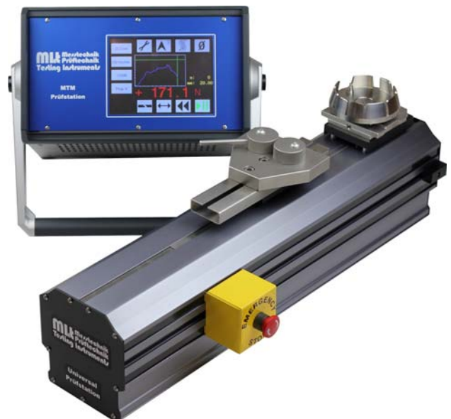
MTM 100 mit SG 80 und DKS-20/A